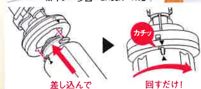
差し込んで 回すだけ！

取り外しは接続ツマミをもち上げて左に回すだけ！ 取り付けは差し込んで右に回して「カチッ」でOK！