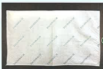
吸水前は約0.2kgの不織布袋

パッケージは、塩素系フィルムを使用していないため、燃やしてもダイオキシンは発生しません。