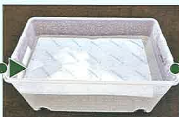
袋全体を水に浸す