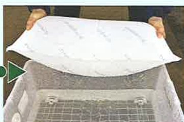
約2分後に約15kgの土嚢が完成